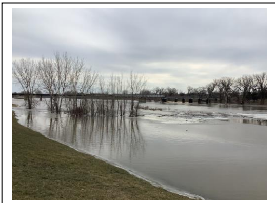
ノースダコタ州とミネソタ州の境界を流れるレッドリバー

グランドフォークス中心部を流れるレッドリバーは雪解け水の影響で、洪水警報が発出されています。過去には大規模な氾濫があったようです。UNDは川からは離れた位置にありますので、ご安心ください。