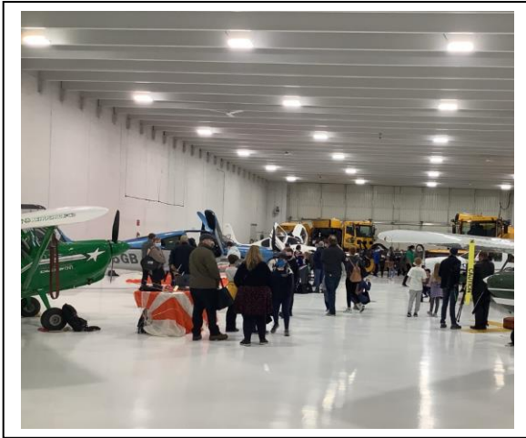
空港の格納庫内にUNDで普段訓練に使用している飛行機を展示しました。

4月2日（土）はUNDのCommunity Dayといって、近隣の住民にUNDの施設を開放し、航空を身近に感じて、理解してもらうイベントがありました。空港の格納庫内に普段訓練で使用している航空機の展示をおこなったり、パイロットや管制官の訓練を行うシミュレーターなどを体験してもらいました。子供ずれのご家族がたくさん訪れました。