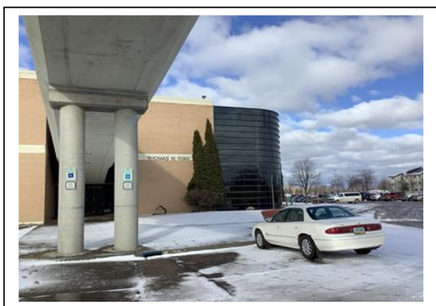
雪が降って、見る見るうちに白くな ってしまうこともあります。